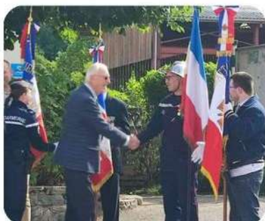
Photo de gauche : Le représentant des anciens combattant saluant les porte-drapeaux