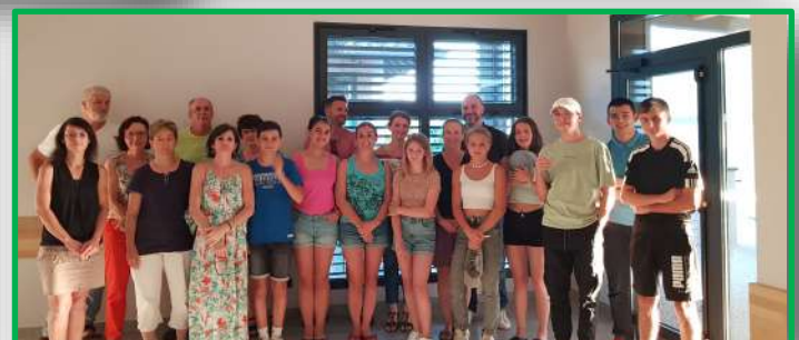
Juillet - Réunion de fin de mandat