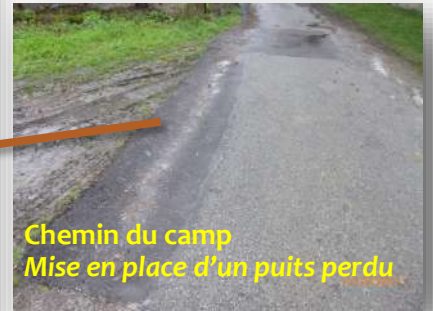
Chemin du camp Mise en place d'un puits perdu