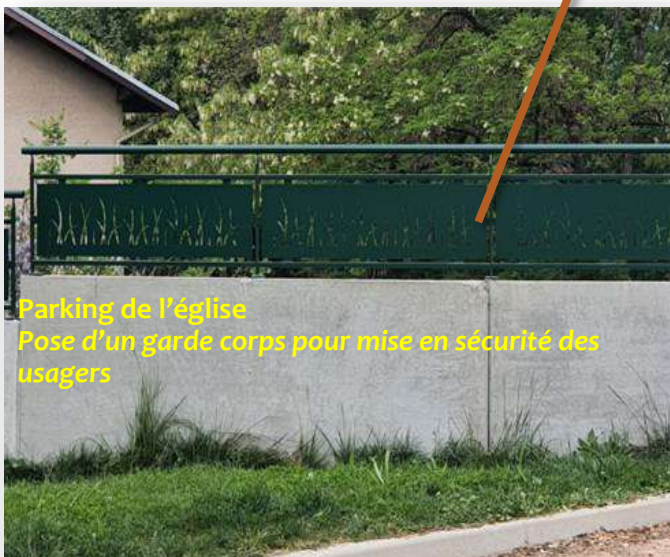
Parking de l'église Pose d'un garde corps pour mise en sécurité des usagers