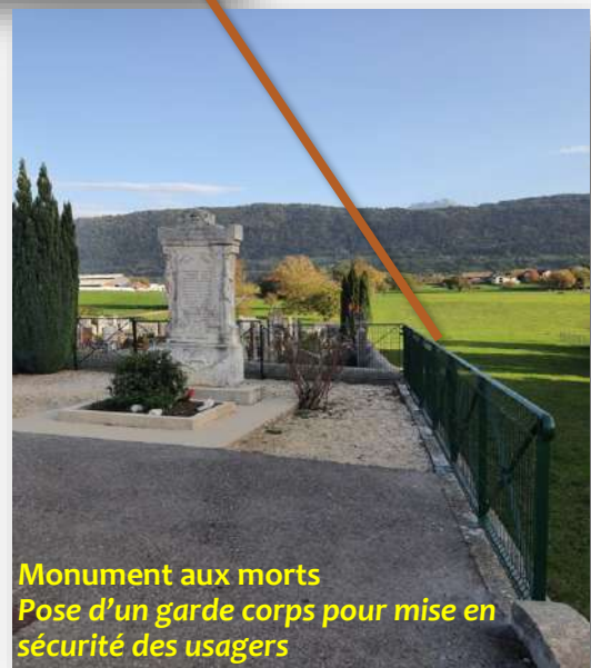
Monument aux morts Pose d'un garde corps pour mise en sécurité des usagers