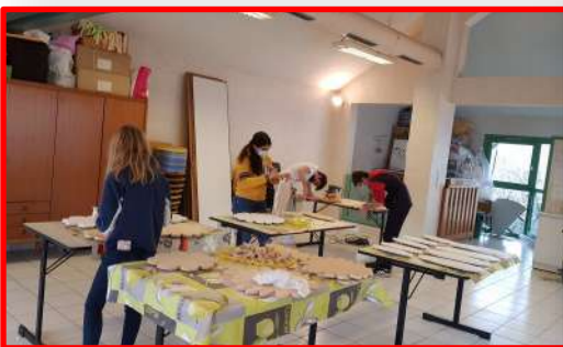
Février - Fleurs géantes en bois