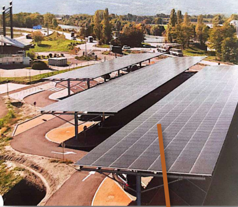
Parking de l'aire de covoiturage, en partenariat avec la Communauté de Communes et l'AREA