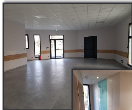
Intérieur de la salle annexe